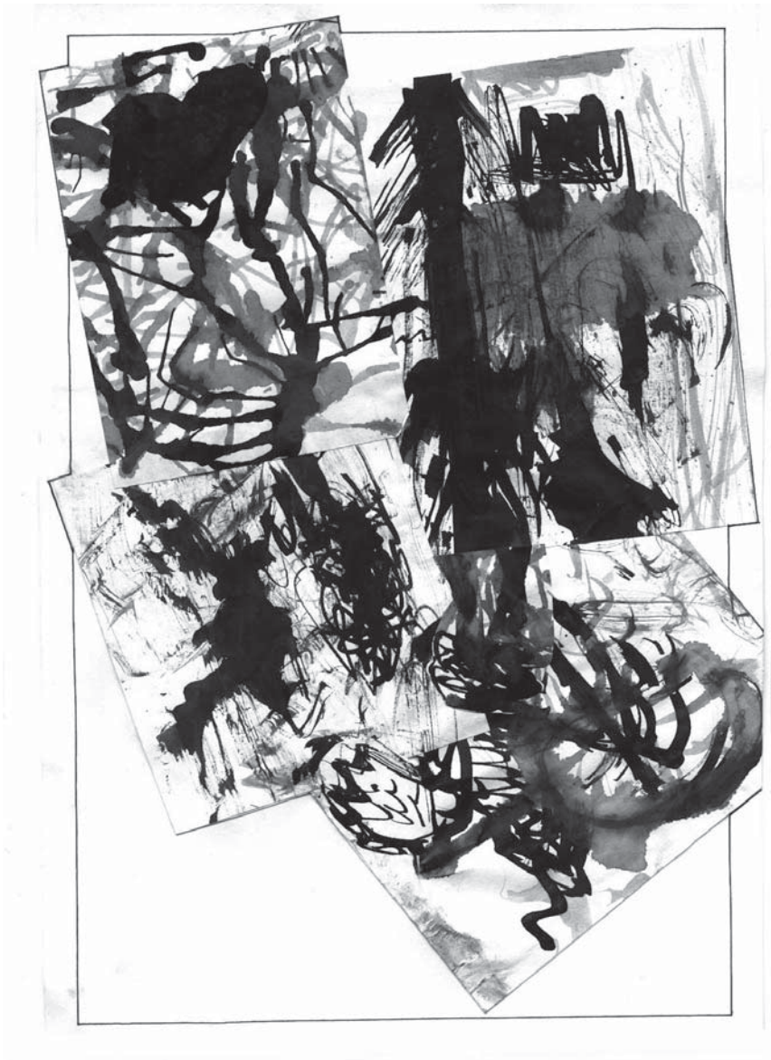
Meret Sauerbaum, 7B, "ohne Titel" Collage aus grafischen Übungen mit ScribtoL.

Wer die beeindruckendste Interpretation schriftlich formuliert, erhält ein Frühstück im Schulcafé.