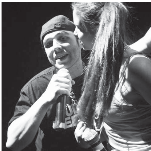
Frühlings Erwachen: Impression Nr. 4