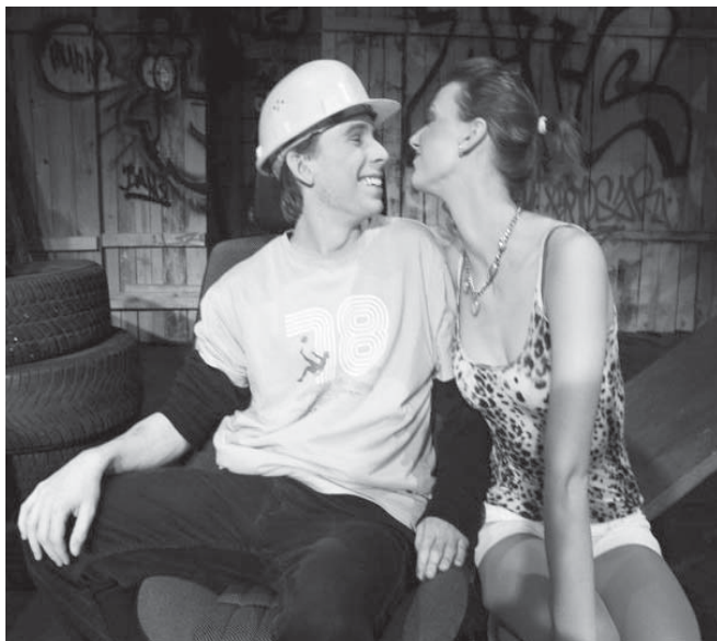
Frühlings Erwachen: Impression Nr. 2

Lehrkräfte die Beethoven-Schule verlassen (auf Grund der Senatspolitik).