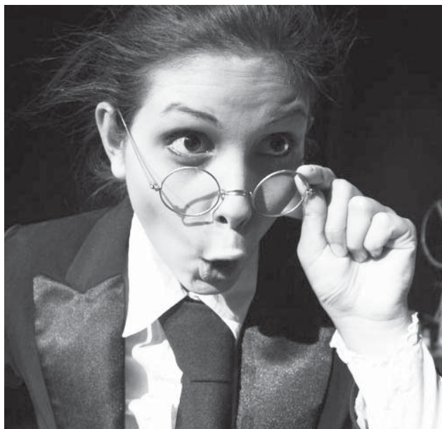
Frühlings Erwachen: Impression Nr. 3

- Schulfest am 10. Juli: Grill und Getränke übernehmen ein Caterer, Kosten ca. 2.000,- €.