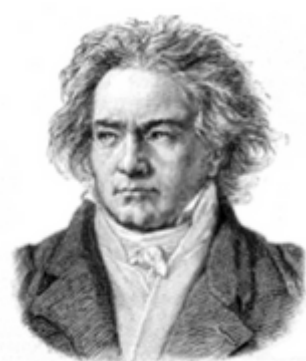
Beethoven-Gymnasium Berlin, Zusatzkurs Politik & Wirtschaft